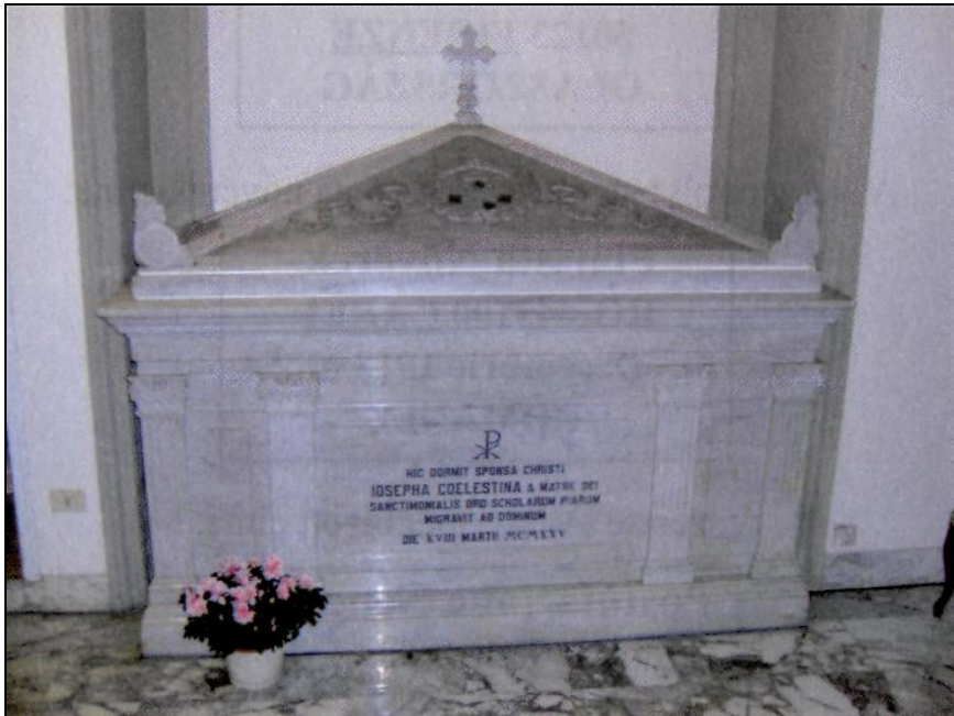
Boldog Celestina Donati sírja Firenzében, a piarista nővérek templomában

Istenünk, te Boldog Celestina nővér életével csodálatos példát adtál nekünk az Oltáriszentség iránti tiszteletre és a leginkább rászoruló kisgyermek és fiatalok iránti odaadó anyai szeretetre, engedd meg, hogy közbenjárására mindig bízni tudjunk az isteni gondviselésben és így a keresztény igazság hiteles tanúivá lehessünk. Krisztus, a mi Urunk által. Amen.