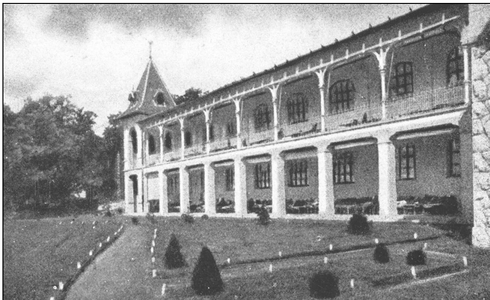
A budakeszi Erzsébet királyné-szanatórium. Fekvőcsarnok