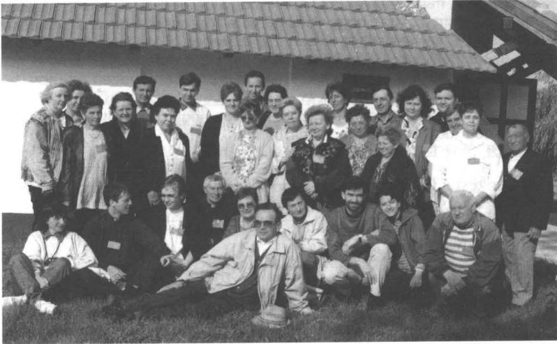
A szeminárium résztvevői